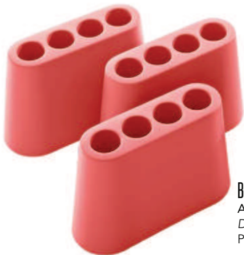
B-LINE AKI Design Rodolfo Bonetto Portaombrelli in polietilene