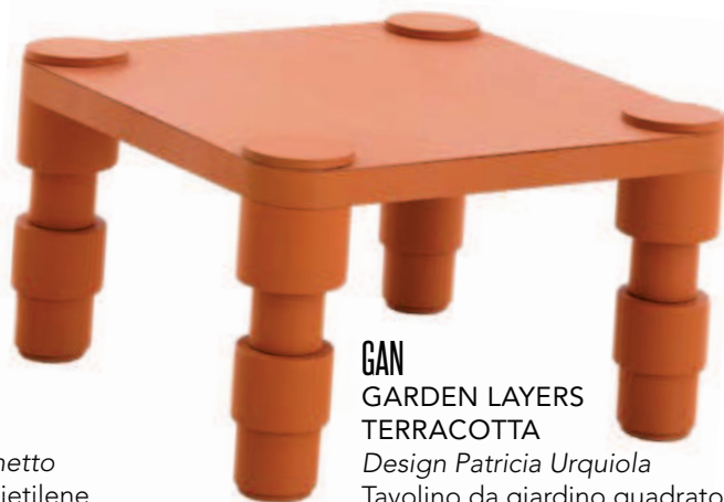
GAN GARDEN LAYERS TERRACOTTA Design Patricia Urquiola Tavolino da giardino quadrato in alluminio termolaccato