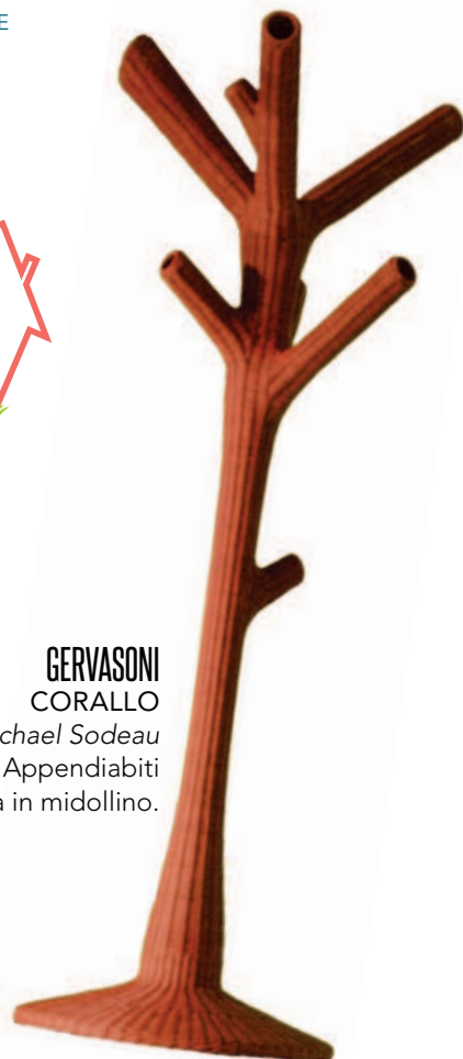
GERVASONI CORALLO Design Michael Sodeau Appendiabiti da terra in midollino.